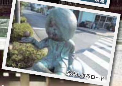
氷木しげるロード